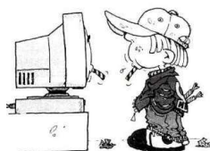
Alla scoperta del computer