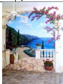
Colori del Mediterraneo Conoscere e recuperare le tradizioni della nostra terra