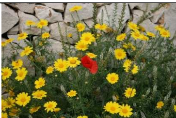
Tanti fiori nella scuola (Giardinaggio e studio delle piante)