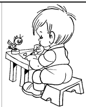
Progetto di letto-scrittura