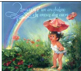
La scuola dell'amicizia