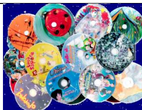
Fantasia lungo una strada in dvd (Cineforum per gli alunni più piccoli)